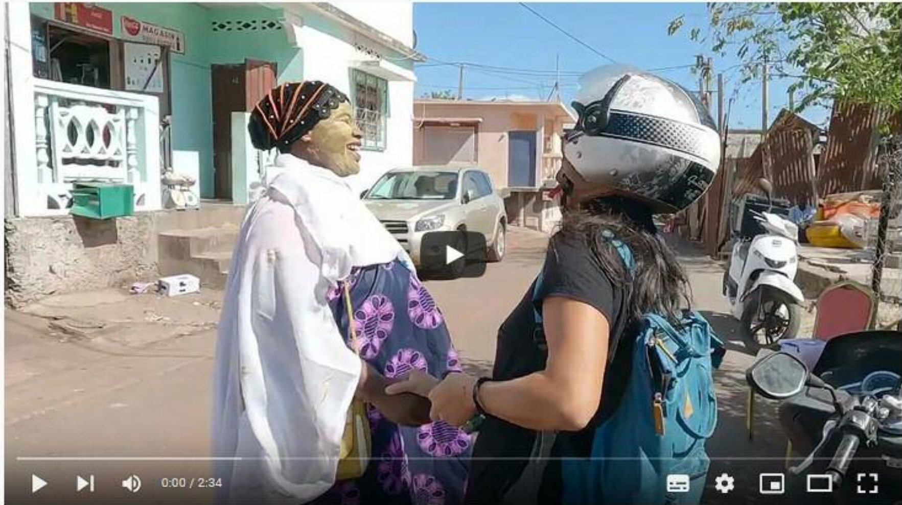
Les kinésithérapeutes de Mayotte