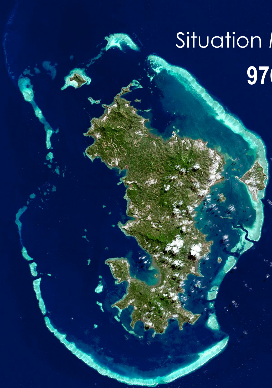
Image satellite Landsat 8